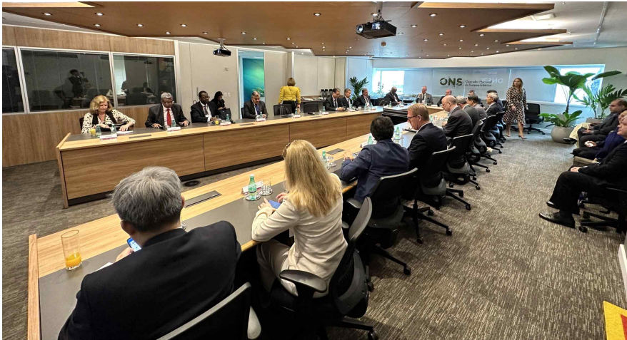
ONS 본사 방문 및 업무소개