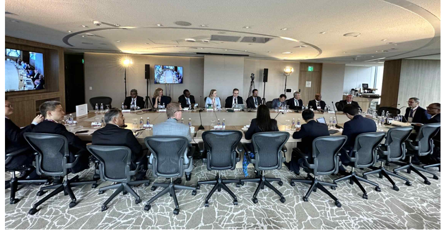
Governing Board Meeting