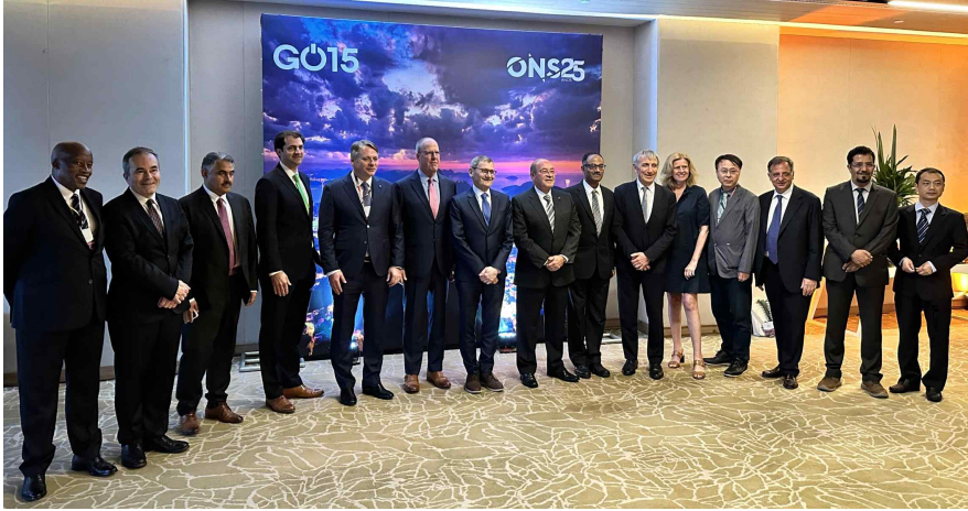
Steering Board Meeting